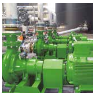
MAGNUM SX Pompe à lisier et à matières épaisses