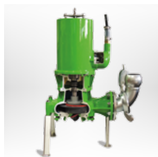
MAGNUM CSPH Pompe submersible