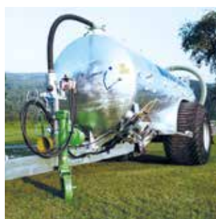
Citernes à lisier Citernes aciers et polyester