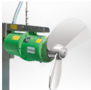
MSXH Agitateur submersible