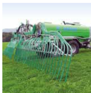
Epandeurs à lisier Epandeurs pendillards et à patins