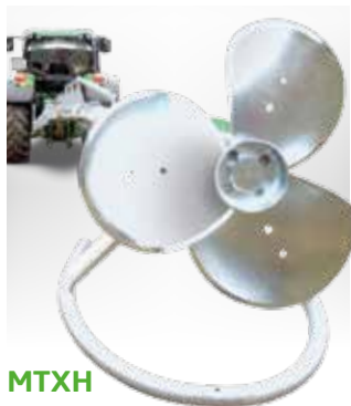
MTXH Mixeur à tracteur