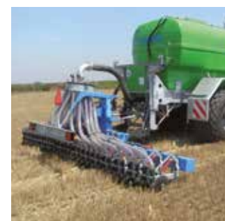
Injecteurs à lisiers Injecteurs à disques, à dents ou à charrues