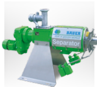
SÉPARATEUR de phase fixe Séparateur à vis pour la séparation liquide-solide