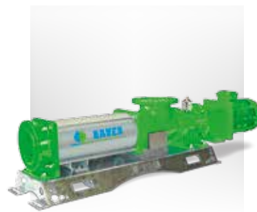
HELIX DRIVE Pompe hélicoïdale