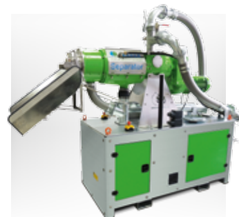
SÉPARATEUR PLUG & PLAY Unité mobile de séparation de phase