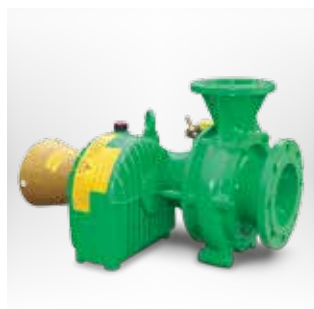
MAGNUM SM Pompe centrifuge